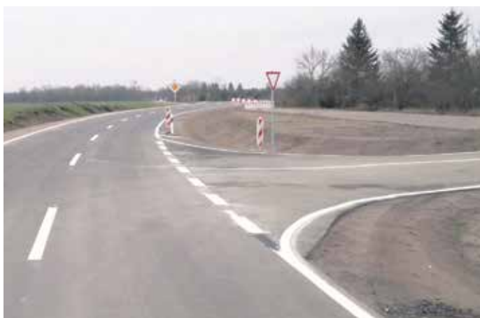
Der sanierte Abschnitt der K 8570 am Abzweig nach Lichtensee

Die Kreisstraße zwischen Wülknitz und Lichtensee (K 8570) wurde Mitte Dezember 2024 wieder für den Verkehr freigegeben. Mit der Fertigstellung des zweiten Bauabschnittes wird die Kreisstraße aus der Ortsdurchfahrt Lichtensee (Bahnhofstraße) auf die Panzerstraße südlich von Lichtensee verlegt und somit als Ortsumfahrung wirksam. Die Ortslage Lichtensee wird damit vom Verkehr entlastet und die