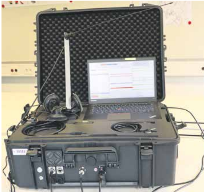
Einer der Krisenkommunikationskoffer

Der Feldtest fand im Amt für Brand-, Katastrophenschutz und Rettungswesen in Großenhain sowie im gesamten Landkreis Meißen, in Dresden bei der Rettungsleitstelle sowie in den Landratsämtern der Nachbarlandkreise Bautzen und Sächsische Schweiz-Osterzgebirge statt. Im Mittelpunkt standen die Krisenkommunikationskoffer