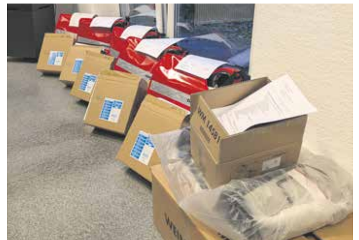
Die neuen Medizinprodukte

Diese Anschaffungen kommen allen Bürgerinnen und Bürgern des Landkreises zugute. Sie ermöglichen