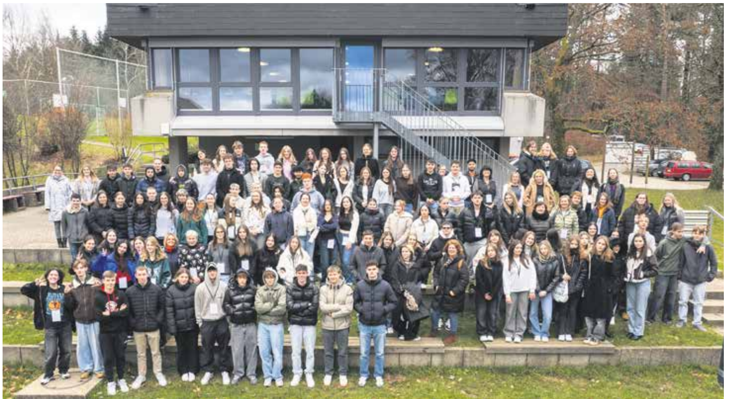
Rund 100 Jugendliche aus drei Ländern waren im Mönchhof zusammengekommen.

Ende November hatte das Landratsamt Rems-Murr-Kreis den ersten europäischen Jugenddialog in der Waldakademie Mönchhof organisiert. Rund 100 Jugendliche aus vier Partnerlandkreisen und drei Ländern haben an der Veranstaltung teilgenommen: Die Schülerinnen und Schüler kamen aus dem Rems-Murr-Kreis, dem Landkreis Meißen (Deutschland), der Gespantschaft Međimurje (Kroatien) und dem Komitat Baranya (Ungarn).