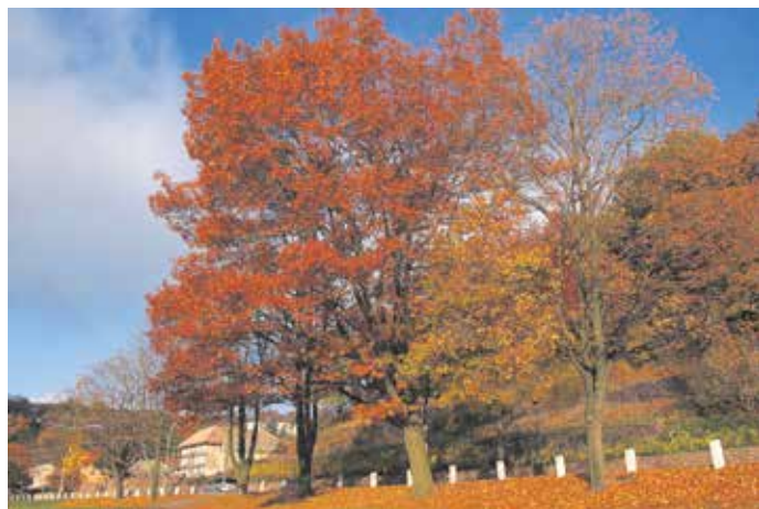
Rot-Eiche in brillanter Herbstfärbung an der Elbe in Diesbar-Seußlitz

bei Stiel- und Trauben-Eichen erst im Herbst des Folgejahres. Die Verbreitung der