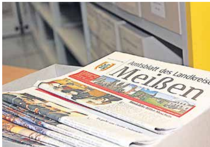
Zurückgeblättert im Archiv des Landkreises

Biotonne zum Nulltarif Anfang 2015 wurde der