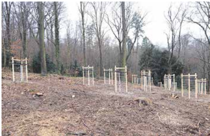
Klimahain in Meißen

Die Stadt Meißen verfügt mit dem Park Siebeneichen über einen der ältesten englischen Landschaftsparks Sachsens und Deutschlands mit großer Bedeutung als Natur- und Kulturdenkmal. „Dieser Standort ist prädestiniert für die Durchführung dieses be-