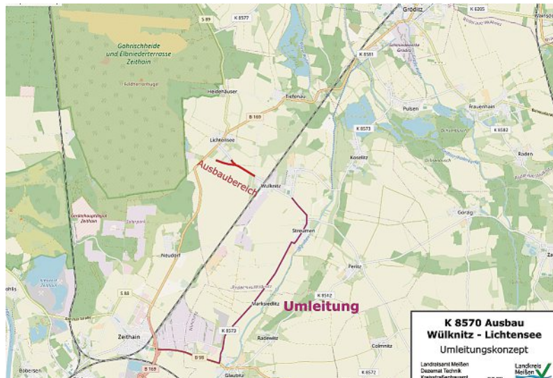
Wülknitz: Umleitungsführung zur Baumaßnahme auf der K 8570 Wülknitz – Lichtensee