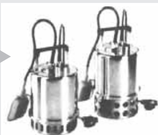
Selbstansaugende Kreiselpumpe, SK-32/Mgk

Tauchmotorpumpen für Haus und Garten BEST ONE/BEST ONE VOX