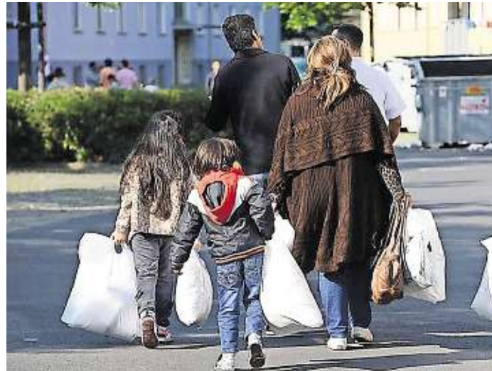
Asyl in Deutschland - für tausende Menschen der einzige Weg aus einer aussichtslosen Lebenssituation in Kriegsgebieten.

Jugendliche vom 15. bis zum 18. Lebensjahr erhalten insgesamt pro Person 277 Euro im Monat, Heranwachsende bis zur Vollendung des 14. Lebensjahres 244 Euro monatlich und Kinder bis zur Vollendung des 6. Lebensjahres 212 Euro. Die Kosten für Unterkunft, medizinische Leistungen, Sprachkurse, Geld für Kita- und Hortplätze sowie die soziale Begleitung und Beratung übernimmt der Landkreis bzw. die kreisfreie Stadt. Pro Asylbewerber erhält der Landkreis eine Pauschale vom Bund in Höhe von 7 600 Euro pro Jahr für alle Leistungen. In den