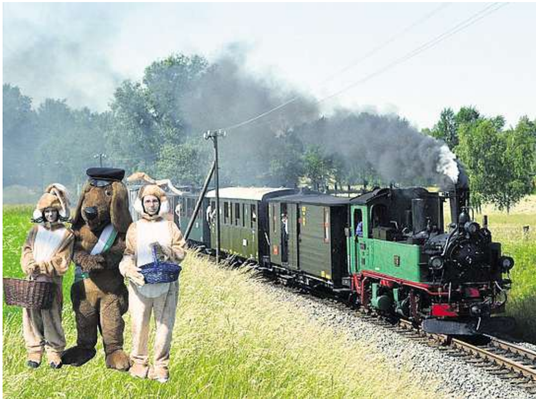
Auf Osterhasenfahrt durch den Lößnitzgrund.