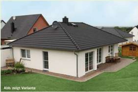
Abb. zeigt Variante

Ihr Partner aus der Region seit mehr als 20 Jahren