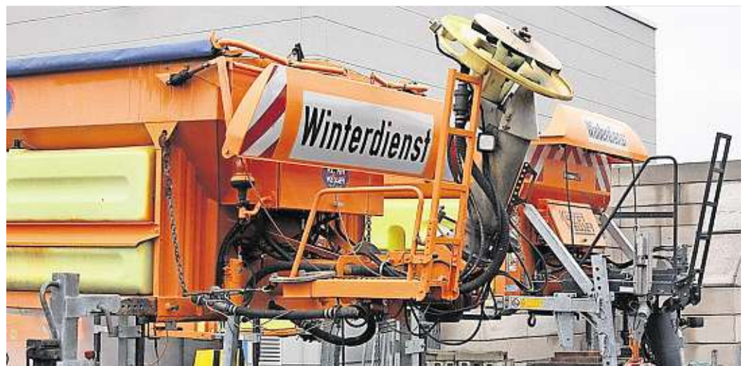
In dieser Saison hatten die Straßenmeistereien wenige Wintereinsätze.

Insgesamt wurden in diesem Winter 2 028 Tonnen Salz gestreut, zum Vergleich - 2012/13 waren es 6 875 Tonnen. Nur im Winter 2013/14 war die Menge mit 1 634 Tonnen noch geringer.