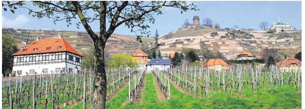
Die Hoflößnitz - eine Perle und das Zentrum der sächsischen Weinkulturlandschaft, sagt der Oberbürgermeister.

Attribute wie das „liebliche Elbtal“ oder die „sächsische Riviera“ vermitteln einen hohen Freizeitwert. Doch hält das Elbtal zwischen Radebeul und Strehla, was die Werbung verspricht? In dieser und den nächsten Ausgaben geht es um Stadtansichten zum weiten Themenkreis Freizeit. Wir fragen die Oberbürgermeister nach ihrer Meinung und beginnen mit Radebeul.