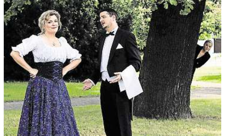
Zum „Weißen Rössl“ gibt es am 25. April auf dem Schloss Wackerbarth einen Begrüßungssekt, ein Abendessen und eine kleine Weinprobe.

■ 26. April - Großenhain, Kulturschloss Oper „Ein Maskenball“ von Giuseppe Verdi mit den Landesbühnen