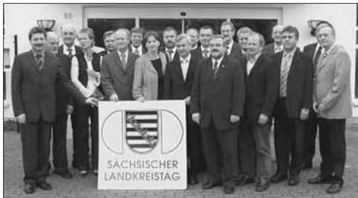
Neuer SLT-Präsident wurde Landrat Tassilo Lenk (6. v. l.), 1. Vizepräsident Landrat Arndt Steinbach (l.) und 2. Vizepräsident Landrat Christoph Scheurer (4. v. r.).

Schwerpunkt der Tagesordnung war die Wahl des Präsidenten und der beiden Vizepräsidenten des Sächsischen Landkreistages (SLT). Zum Präsidenten wählte das Gremium Landrat Tassilo Lenk aus dem Vogtlandkreis, zum 1. Vizepräsidenten Landrat Arndt Steinbach, Landkreis Meißen und zum 2. Vizepräsidenten Landrat Christoph Scheurer, Landkreis Zwickau.