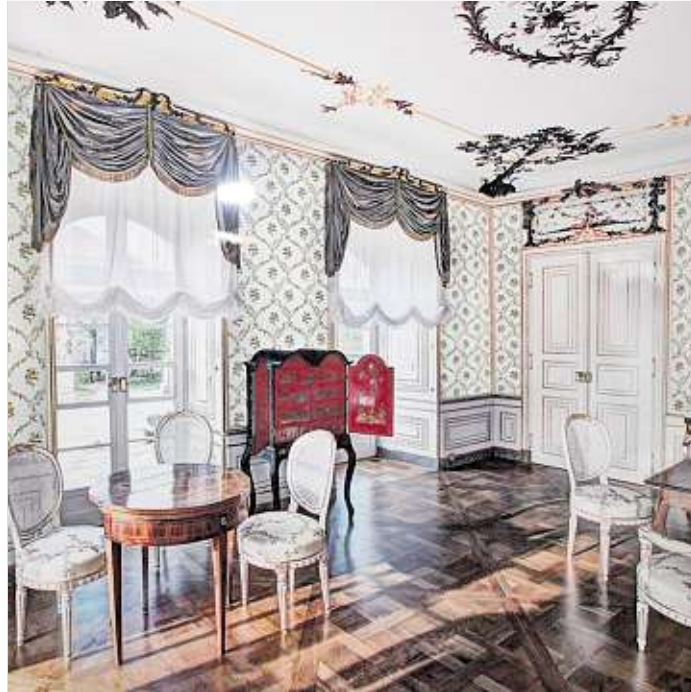
Sachsens kleinste Museumsadresse: das Fasanenschlösschen in Moritzburg

Das ausgedehnte Waldgebiet nordwestlich Dresdens – Friedewald genannt – diente den sächsischen Herrschern neben der Dresdner Heide und dem Tharandter Wald frühzeitig als wichtiges Forstgebiet für die Holzgewin-