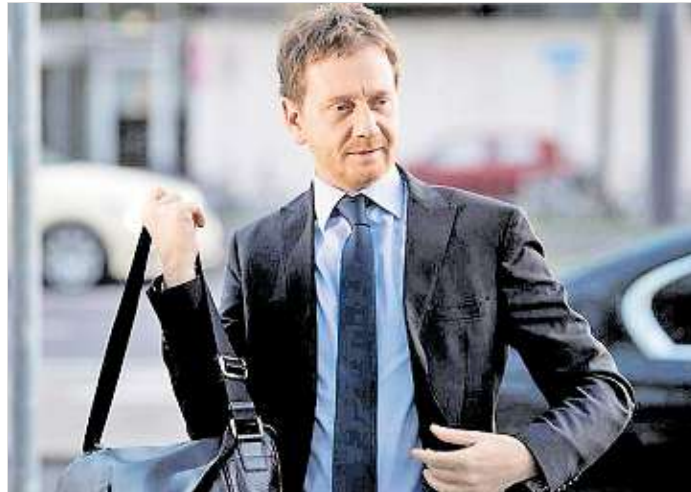
Probleme schultern und mit den Bürgern diskutieren: Ministerpräsident Michael Kretschmer.

Sie wären wohl partiell auch die richtigen Ansprechpartner für die Sorgen und Nöte der Sachsen gewesen. Nicht Zukunft war nämlich das große Thema, sondern All-