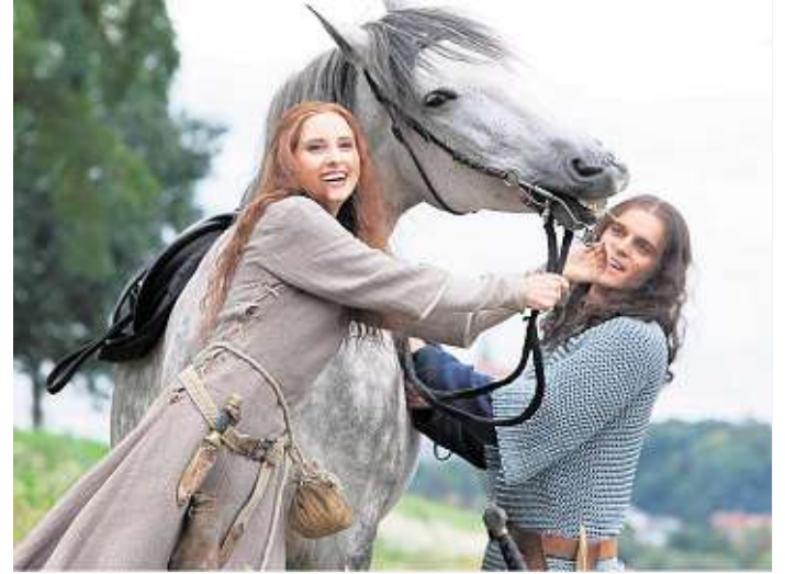
Premiere „Die Hebamme“ auf der Felsenbühne in Rathen und am 23. Juni auch in Meißen anlässlich der Burgfestspiele.

■ 21. Juni – Meißen, Albrechtsburg Burgfestspiele „Das Geheimnis der Hebamme“ nach dem gleichnami-