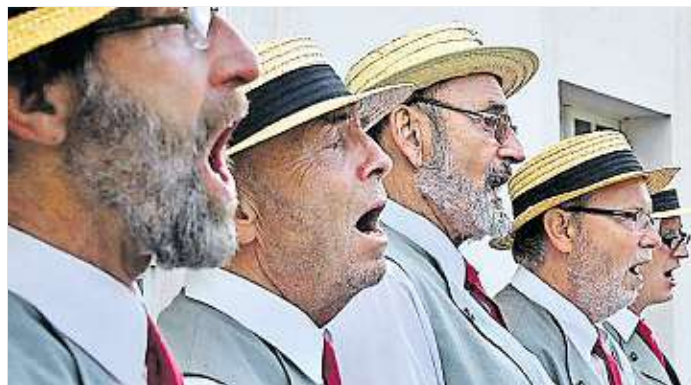
Der Meißner Winzerchor