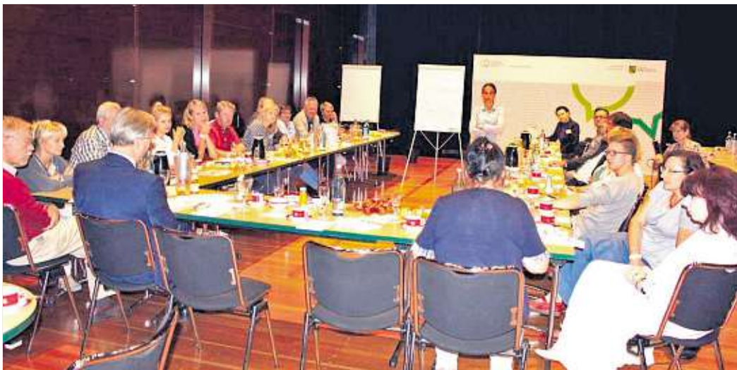
Dialogreihe 2017 in Großenhain