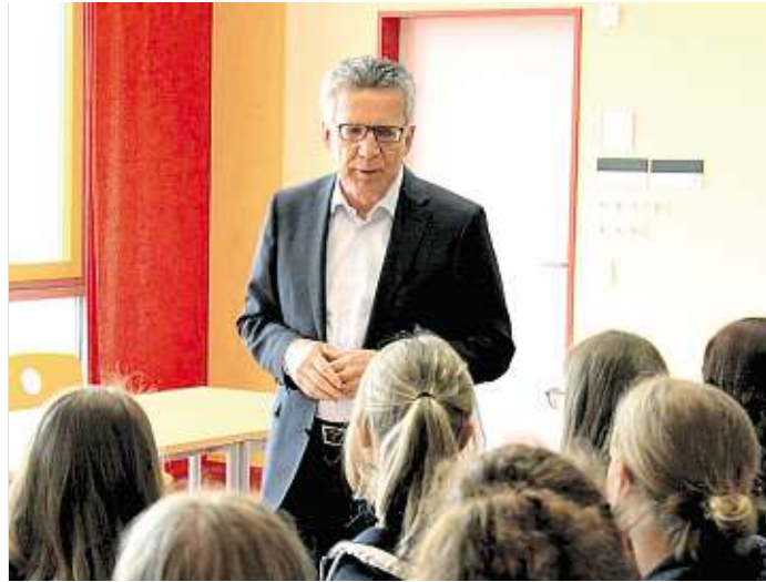
CDU-Bundestagsabgeordneter Dr. Thomas de Maizière im Gespräch mit den Schülerinnen und Schülern.

Dennoch ist es bislang nur partiell gelungen, die Europäerinnen und Europäer von der Zukunft der Gemeinschaft restlos zu überzeugen. Erstaunlich in Nünchritz war, dass keiner der Jugendlichen die EU insgesamt in Frage stellte, sondern den prominenten Bundespolitiker zu Konflikten und Lösungsansätzen befragte: Warum hat Deutschland 2015 die Flüchtlinge aus Un-