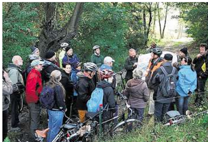
Mehr als nur eine Radtour. Auf den Spuren der Ahnen mit den Landesarchäologen.