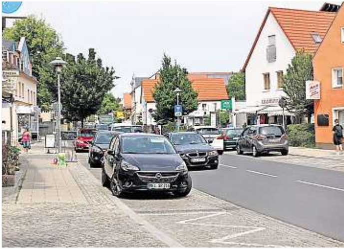
Blick in die Innenstadt von Coswig

Mit unserer Kulturbetriebsgesellschaft Meißner Land mbH, dem Betreiber von Börse und Villa Teresa, hat die Stadtverwaltung den optimalen Partner für so ein Fest. Das sind die Profis für die Kultur – sowohl fürs Programm als auch im Veranstaltungsma-