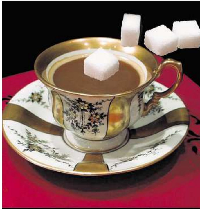
Kaffee schwarz wäre gesünder!

Mehrfachzucker lassen den Blutzuckerspiegel dagegen langsam ansteigen, da die langkettigen Zucker erst in ihre Einzelbausteine zerlegt werden müssen. „Dies schützt auch eher davor, nach dem Essen müde zu werden“, erklärt Linnemann. Deshalb spielen natürliche und unverarbeitete Lebensmittel, die „gesunden“ Zucker liefern, eine wichtige Rolle, denn