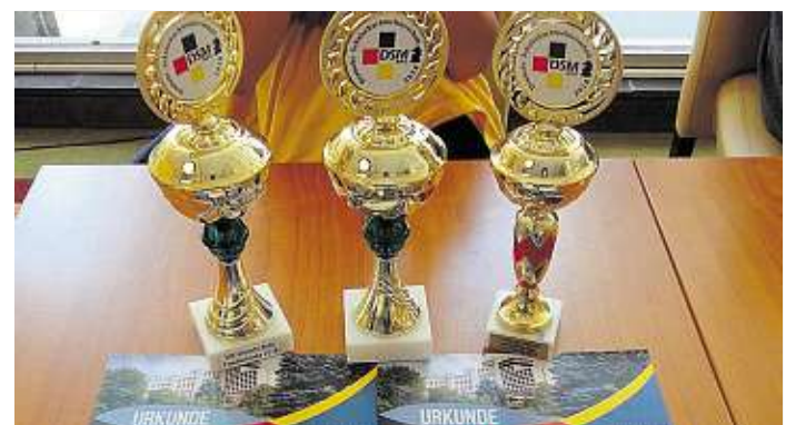
Großer Erfolg für die Jungen und Mädchen aus Coswig.