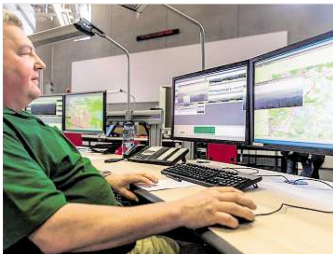
Blick in den Kontrollraum

In den letzten Jahren wurde das System weiterentwickelt und verbessert, wobei auch Hinweise und Wünsche der Nutzer berücksichtigt wurden. Da zwischenzeitlich die Hardware zum Teil verschlissenen und Betriebssysteme nicht