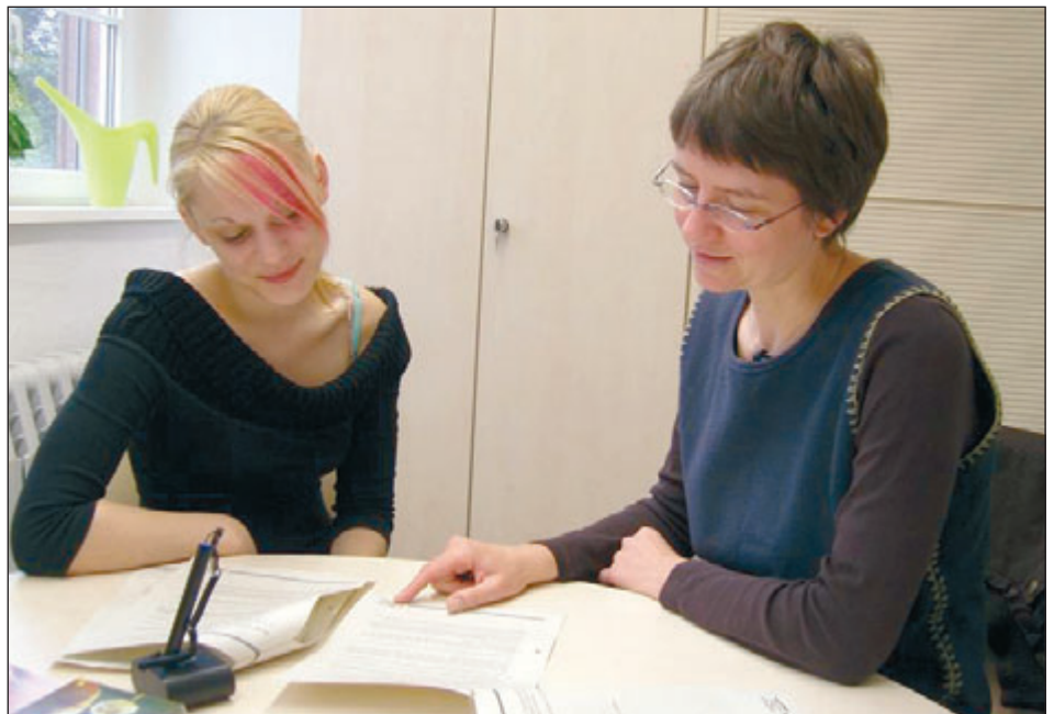
Ausbildungssuchende, die Arbeitslosengeld II beziehen, erhalten im AfAS fachkundige Beratung und Hilfe.

Der Landkreis Meißen wies im September 2008 mit 10,6 Prozent die niedrigste Arbeitslosenquote bei Jugendlichen unter 25 Jahren auf und belegt damit den Spitzenplatz in Sachsen. Die positive Vermittlungsbilanz der Berufsberatung des Amtes für Arbeit und Soziales (AfAS) trägt dazu ihren Teil bei. Für das aktuelle Ausbildungsjahr konnte allen Bewerbern ein Angebot zur Ausbildung, modularen Qualifizierung oder schrittweisen beruflichen Orientierung unterbreitet werden. Von 392 ausbildungswilligen und -fähigen Jugendlichen absolvieren nun 87 eine betriebliche und 56 eine außerbetriebliche Ausbildung. 83 Teilnehmer wurden in das GISA-Programm des Freistaates Sachsen aufgenommen. Die Vermittlung in berufsvorbereitende Maßnahmen erfolgte in 113 Fällen. 53 Jugendliche besuchen eine weiterführende Schule. Prozentual gesehen, lag auch in diesem Jahr der Anteil der Altbewerber mit 75 % deutlich über dem der Schulabgänger. Umso erfreulicher ist es, dass für diesen Personenkreis geeignete Maßnahmen gefunden wurden und die Jugendlichen eine Chance für ihre berufliche Zukunft erhalten. Insgesamt wurden vom Team der Berufsberatung 599 Jugendliche betreut. Aufgrund von z.B. Elternzeit, Wehr-/Zivildienst oder Krankheit sind aktuell 187 nicht vermittlungsfähig bzw. 20 Bewerber aus anderen Gründen noch unversorgt. Diese werden nun je nach Möglichkeit in die Nachvermittlung einbezo-