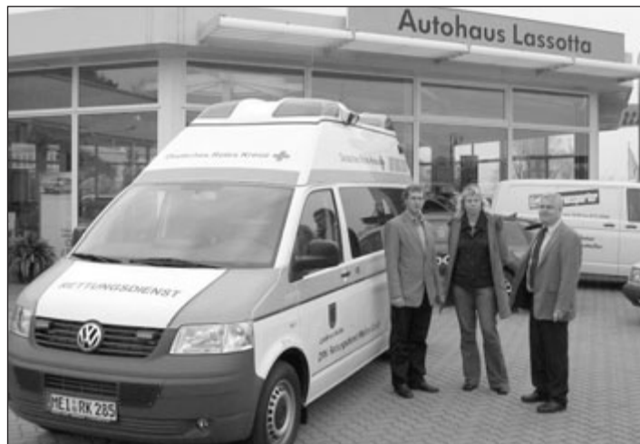
Fahrzeugübergabe vor dem Autohaus Lassotta in Meißen.

Der Landkreis Meißen als Träger des Rettungsdienstes beschaffte im Rahmen der Ersatzinvestition einen neuen Krankentransportwagen (KTW) für die Rettungswache Radebeul. Hierbei handelt es sich um einen VW T5, wobei das Basisfahrzeug durch das VW-Autohaus Lassotta Meißen geliefert und der Ausbau zum Krankentransportwagen durch die Fa. Ambulanzmobile Schönebeck realisiert wurde. Die Übergabe an die DRK Rettungsdienst Meißen gGmbH als Betreiber der Rettungswache Radebeul erfolgte am 03.11.2008. Der KTW Radebeul absolviert im Jahr durchschnittlich 2.300 Einsätze, welche ca. 28 Prozent der gesamten KTW-Fahrten des Leitstellenbereichs Meißen (Altlandkreis Meißen) ausmachen.