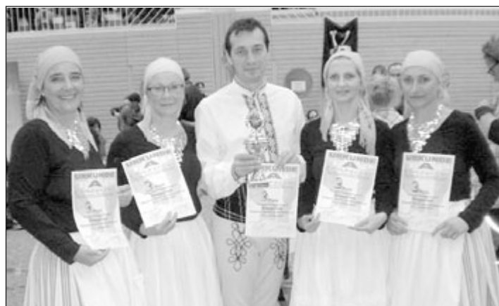
Erfolgreich bei der Süddeutschen Meisterschaft in Kempten: die Gruppe „Stepyness“ aus Riesa.