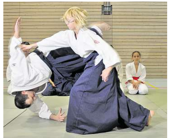
Einladung zum Probetraining, noch in der Halle des BSZ in Meißen!