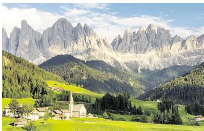
Die Wunder der Erde erwarten Sie am 25. September in der Stadthalle Stern in Riesa. Die Reise führt nach Südtirol.