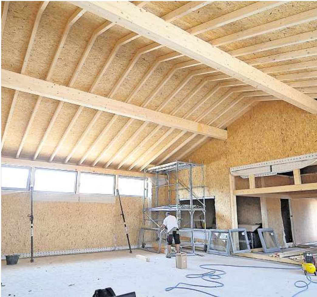
Blick in die neue Halle.

Die japanische Kampfkunst erlebt mit dem Bau einer Halle in Meißen eine neue Dimension