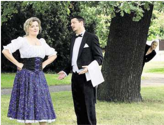
Am 6. September öffnet das „Weiße Rössl“ mit den Landesbühnen Sachsen auf Schloss Schönfeld seine musikalischen Pforten.