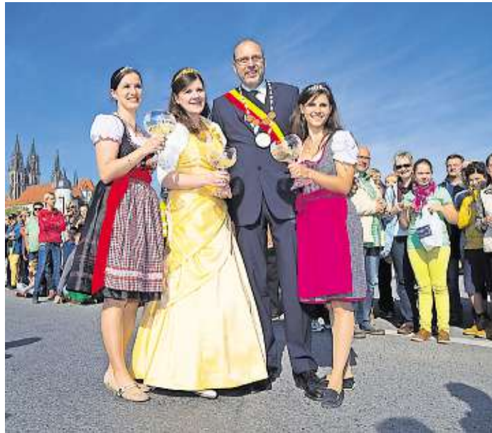
Höhepunkt des Weinfestes ist in jedem Jahr der Weinfestumzug.

Meißen ist eine Stadt, die sich aber nicht nur auf Wein, Porzellan und sächsische Geschichte reduziert. Auch wenn dieses Trio touristisches Lockmittel ist, gibt es ein weitaus größeres Spektrum an Entdecker-Möglichkeiten. Wer seinen Besuch nach dem Veranstaltungskalender des Landkreises plant ( www.kreis-meissen.de ), erlebt eine Kreisstadt mit einem bunten Jahresprogramm, das keinen Monat ausspart und eine Spitzenposition in Sachsen einnimmt. Von September bis Juni lädt das Stadttheater ohne eigenes Ensemble zu Kabarett, Märchen, Oper, Musical, Comedy ein. Inzwischen sind auch die Weinberge privater Winzer und der Genossenschaft Genuss- und Konzertkulisse u.a. für die Musiker der Elbland Philharmonie Sachsen. Zu den Höhepunkten gehören in Meißen das bevorstehende Weinfest (25. bis 27. September 2015), übrigens das größte im Elbtal. Kein namhafter Winzer fehlt, die Altstadtthöfe sind für Wein, Musik und Tanz geöffnet, entlang der Gassen und auf