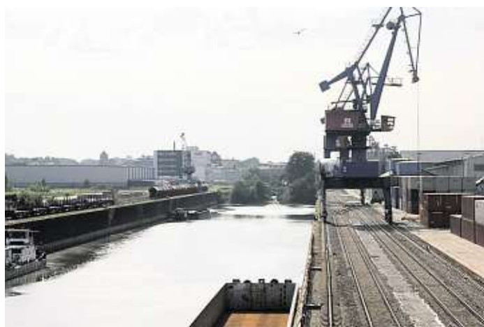
Blick auf den Binnenhafen.

Innerhalb von nur neun Monaten wurden rund fünf Millionen Euro in den Bau einer Containerservicehalle, eines Containerabfertigungsgebäudes, einer Zufahrtsstraße und eines Containerabstellplatzes investiert. Damit ist der erste Abschnitt eines trimodalen