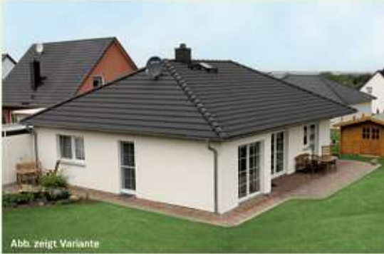
Abb. zeigt Variante

Ihr Partner aus der Region seit mehr als 20 Jahren