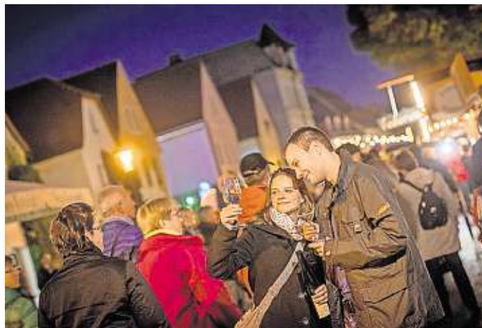
In dieser Nacht wird nicht geschlafen! Jedenfalls zum Herbst- und Weinfest in Radebeul nicht.

Mein dritter Tipp bedeutet eigentlich „Eulen nach Athen tragen“. Doch in diesem Jahr feiert das Radebeuler Herbst- und