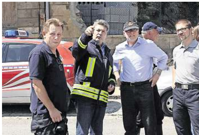
Landrat Johannes Fuchs (2.v.r.) während der Flut 2013 im Landkreis Meißen mit Landrat Arndt Steinbach (3.v.r.) unterwegs.

Ergänzt wird Winnenden durch eine zweite Klinik in Schorndorf mit 286 Betten, darunter eine hochspezialisierte Geriatrie mit zertifiziertem Schlaganfall- und Traumazentrum. Der Klinikbau hingegen verlief nicht konfliktfrei, denn der Talstandort in Winnenden sorgte für erhebliche Bauverzögerung und Kostenexplosion. Kurz vor dem Innenausbau strömte Wasser in den unteren Bereich,