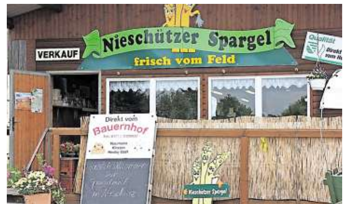
Im Landkreis Meißen ist Nieschützer in der Gemeinde Diera-Zehren das Zentrum des Spargelanbaus. Das Foto entstand zur Spargelmeile am 6. Mai 2015.

Die vorläufigen Ergebnisse der diesjährigen Erdbeerenernte zeigen einen deutlichen Rückgang gegenüber dem Vorjahr. Mit einem Ertrag von gut 60 Dezitonnen je Hektar im Freiland lag dieser fast um ein Drittel unter dem Vorjahreswert von 87 Dezitonnen. Die Anbaufläche im Freiland wurde um fast 80 Hektar auf 510 Hektar reduziert. Darunter waren 110 Hektar, die noch nicht im Ertrag standen. Dies führte dazu, dass die Erntemenge