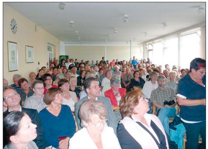
Der Einladung zum Podiumsgespräch waren ca. 200 Klinikangestellte, niedergelassene Ärzte sowie Patienten und deren Angehörige gefolgt.