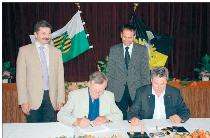
Unterzeichnung der Vereinbarung über die Eingliederung am 26. Mai.