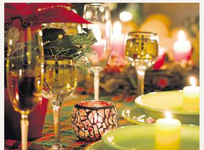
Die ELBLAND Rehaklinik in Großenhain lädt zu weihnachtlichen Gesundheitstagen.

Die ELBLAND Rehaklinik in Großenhain bietet zum Großenhainer Weihnachtsmarkt und im Advent Gesundheitstage an. Darüber hinaus gibt es zusätzliche weihnachtliche Angebote, welche kostenfrei sind. Die Angebote im einzelnen können in der Rehaklinik Großenhain erfragt werden.