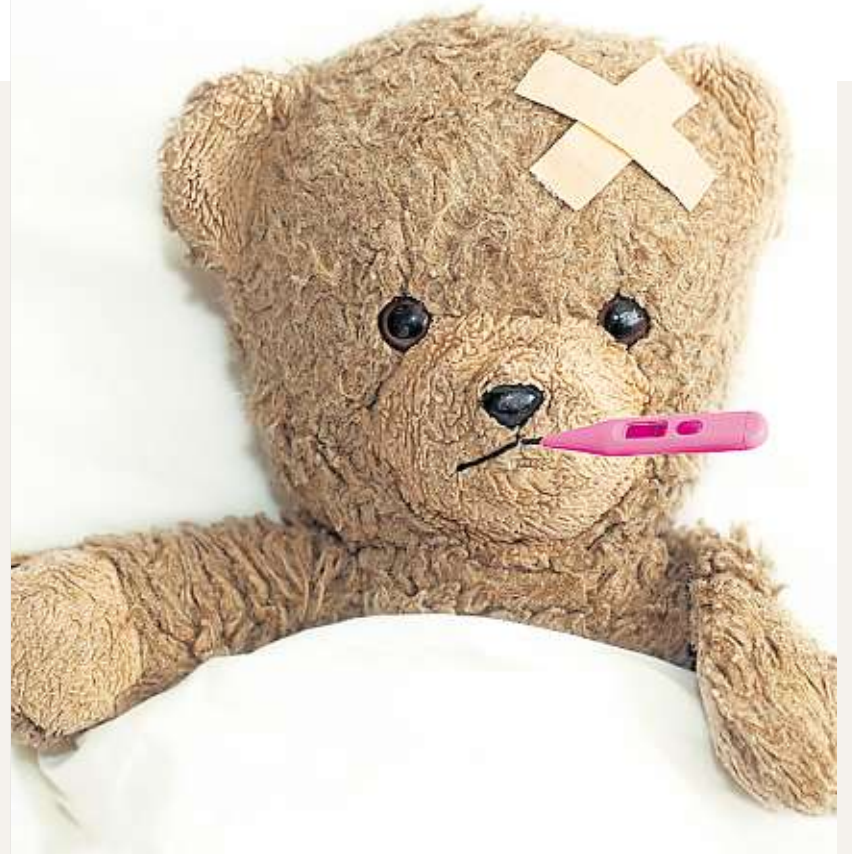
Der Patientenbär Benni wurde von den Kindern des Kindergartens „Bärenfreunde“ von seinen Bauchschmerzen befreit.