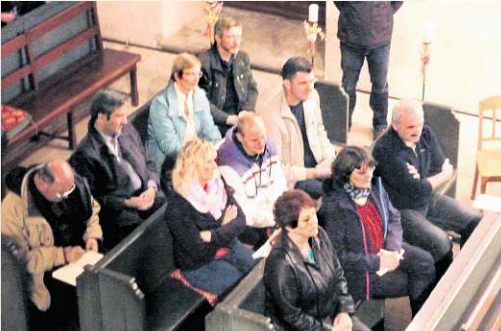
Blick auf die Anwohner. Unter ihnen auch Riasas Oberbürgermeisterin Gerti Töpfer.

Die antragstellende Person muss Verfolgung erlitten haben bzw. ihr muss Gewalt oder Freiheitsentzug mit hoher Wahrscheinlichkeit im Herkunftsland bei Rückreise drohen. Ehegatten und minderjährige Kinder von Asylberechtigten erhalten in der Regel ebenfalls Asyl (Familienasyl). Sogenannte „Asylerbliche Merkmale“ sind zudem nach dem Wortlaut der Genfer Flüchtlingskonvention (GK) die Rasse, Religion, Nationalität, Zugehörigkeit zu einer bestimmten sozialen Gruppe und politische Überzeugung (GFK-Flüchtlinge). Allgemeine Notsituationen - wie Armut, Bürgerkriege, Naturkatastrophen oder Arbeitslosigkeit - sind damit als Gründe für eine Asylgewährung ausgeschlossen.