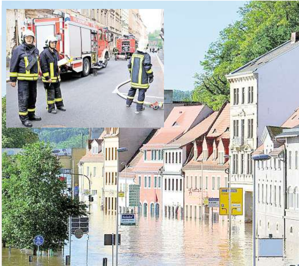
Diese Bilder gehören zum Jahr 2013 und zur Feuerwehr im Landkreis Meißen. Die Flut war ein wichtiges Thema auf der Kreisdelegiertenkonferenz.

Das Wort von der „Pflichtfeuerwehr“ macht die Runde ebenso die „Feuerwehrrente“, die mehr Wahlversprechen des Freistaates war als dass sie eine reale Chance hatte. Erfolgreich war allerdings