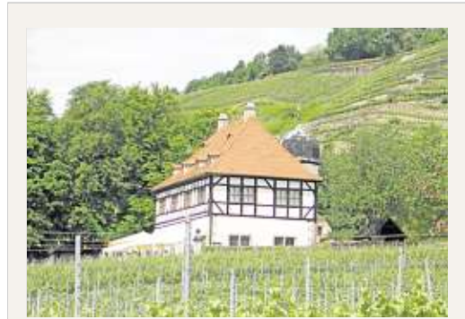
Das Lusthaus soll bald auch wieder Besuchern zugänglich sein.

Die morschen Diele in den ehemaligen Gemächern des Kurfürsten im 1. Stock wurden bereits restauriert. Auch ein Großteil der Fenster kommt in neuem alten Glanz daher. Aktuell sind die Dachdecker und -klempner am Werk, um das