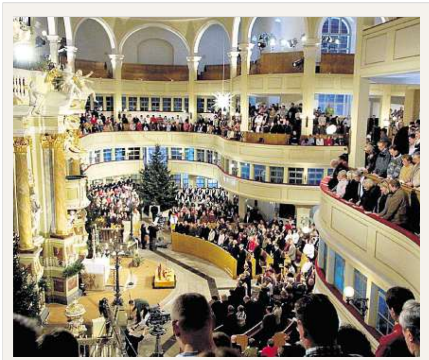
Die weihnachtlich geschmückte Marienkirche in Großenhain lädt zu Festkonzerten im Dezember ein.