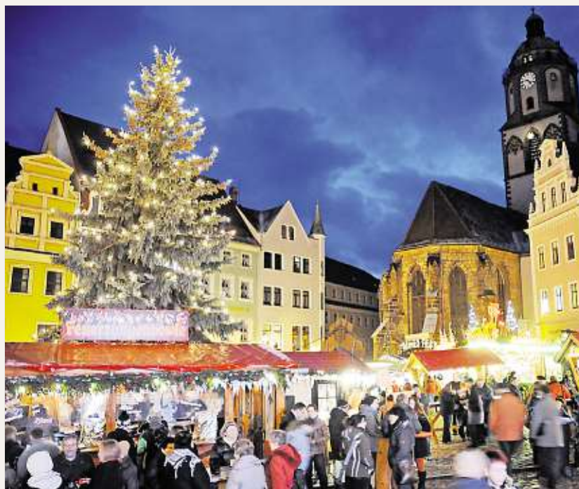
Das Besondere am Meißner Weihnachtsmarkt ist der Adventskalender am historischen Rathaus, mit Verlosung und Programm.