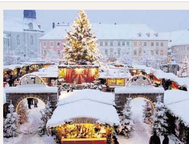
Bis zum 22. Dezember lädt in diesem Jahr der Großenhainer Weihnachtsmarkt täglich von 10 bis 19 Uhr, freitags und samstags bis 20 Uhr ein. Er gehört zu den stimmungsvollsten Weihnachtsmärkten im Elbtal.

Tradition. Seit dem 16. November lädt auf Schloss Moritzburg die diesjährige Aschenbrödel-Ausstellung ein. Diesmal geht es im „Winterschloss“ um das 40-jährige Filmjubiläum „3 Haselnüsse für Aschenbrödel“, begleitet von einem märchenhaften Kinderprogramm im Schlossturm. Und wenn Sie in Familie einen Ausflug nach Moritzburg planen, dann empfehle ich auch einen Besuch im Wildgehege und einen Spaziergang durch den Moritzburger Forst . Im Wildgehege können Kinder seit diesem Jahr Wildtiere streicheln. Beim Gehegeneubau wurde auf einen trennenden Zaun verzichtet, um direkten Kontakt zu den Sika-Muttertieren und Kälbern zu ermöglichen. Das „BAMBI-Streichelgehege“ befindet sich unmittelbar rechts nach dem Eingang in Waldlage entlang des Weges bis zum Falkenhof. Mehr Informationen und Öffnungszeiten unter www.schloss-moritzburg.de oder www.moritzburg.de . Nach Schloss Lauter-