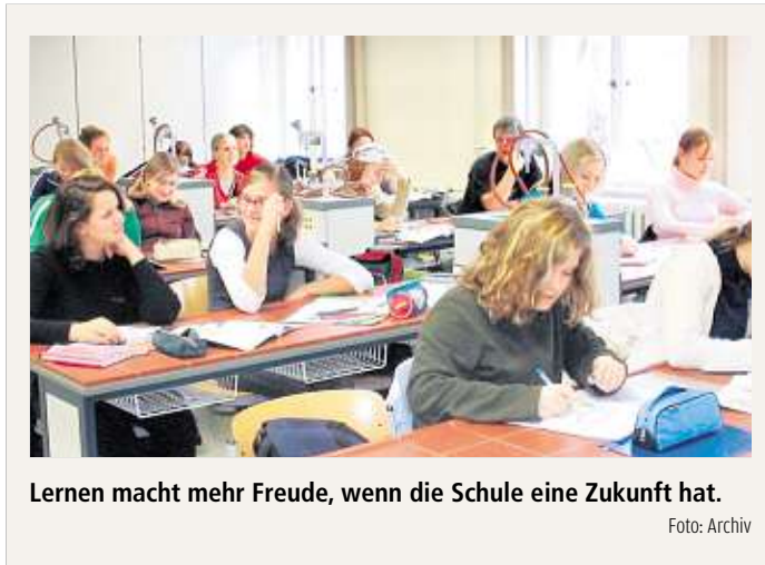
Lernen macht mehr Freude, wenn die Schule eine Zukunft hat.

Im Landkreis Meißen gibt es derzeit 43 Grundschulen in kom-