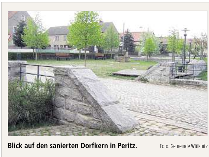
Blick auf den sanierten Dorfkern in Peritz.