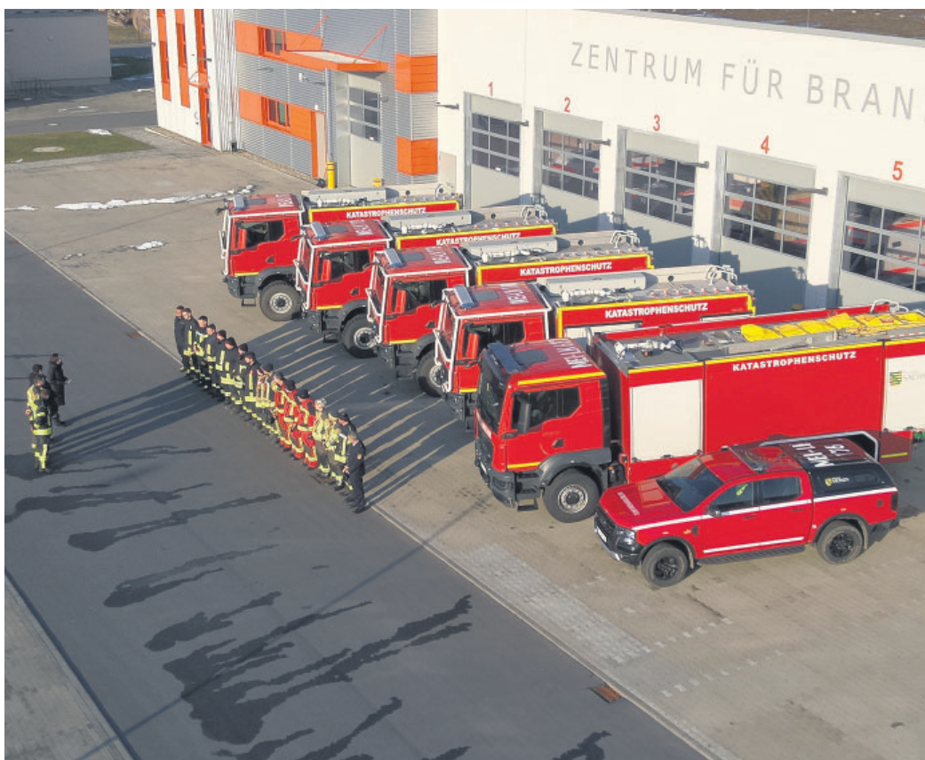
Der komplette Löschzug „Waldbrand“ des Landkreises Meißen vor dem Zentrum für Brand- und Katastrophenschutz

Um dem zu begegnen, hat der Freistaat Sachsen eine Strategische Waldbrandschutzkonzeption entwickelt. Deren Schwerpunkt ist die Stärkung des abwehrenden Brandschutzes durch den Aufbau und die Weiterentwicklung spezialisierter Katastrophenschutz-Löschzüge „Waldbrand“. So sollen eine schnellere, effizientere und wirtschaftlichere Brandbekämpfung möglich sein, das Ökosystem Wald und die Bevölkerung besser geschützt und nicht zuletzt