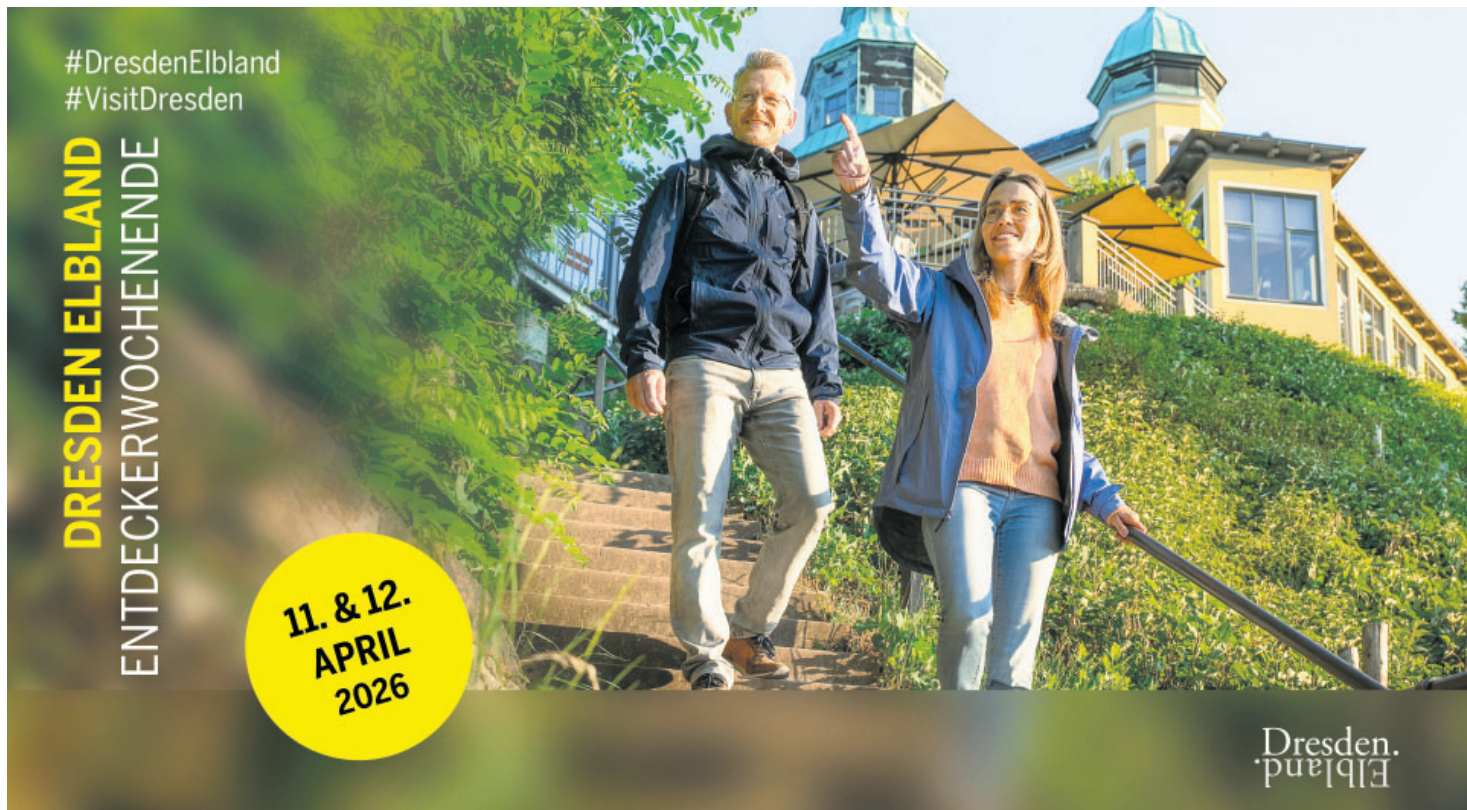
Das Elbland lädt zum Entdeckerwochenende