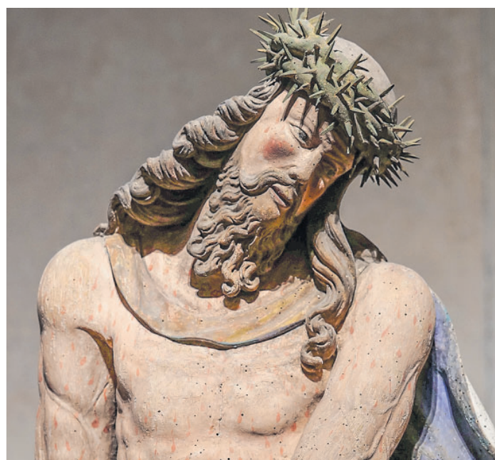
Dom zu Meißen: Sonderführung „Die Kraft des Leidens“ am 29. März

▪ Ostermarkt Meißen (außer Karfreitag) | rund um den Marktplatz, Meißen