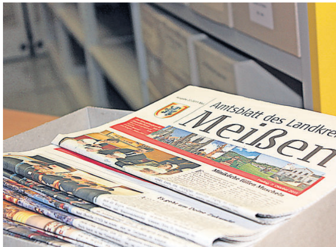
Zurückgeblättert im Archiv des Landkreises

Die Schauhalle im ersten Obergeschoss der Porzellanmanufaktur wurde vor zehn Jahren neu in Szene gesetzt. Neben leuchtenden Hintergründen in den originalen Eichenholzvitrienen wurden lang verborgene Stücke aus dem Depot in das Porzellan-Museum geholt. Als nächsten Schritt plante die Meissen Porzellan-Stiftung die Einrichtung des zweiten Obergeschosses für Sonderausstellungen.