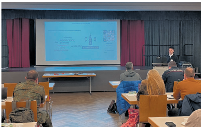
Vortrag im Rahmen des KriKom-Treffens

Im Rahmen eines Workshops haben die projektbeteiligten Verbundpartner Hasso Plattner Institut (HPI) sowie die h 2 - Hochschule Magdeburg-Stendal gemeinsam mit den assoziierten Partnern des Verbundprojekts an verschiedenen Arbeitsstationen zentrale Fragen der Krisenvorsorge unter anderem während eines flächendeckenden und langanhaltenden Stromausfalls bearbeitet.