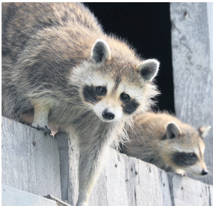
Waschbär – niedlicher kleiner Räuber oder Plagegeist?

Im ersten Schritt sollten stets mildere Mittel gewählt werden: Das Habitat – der Garten – sollte so unattraktiv wie möglich sein. Dazu sollten sämtliche Nahrungsquellen entzogen werden: