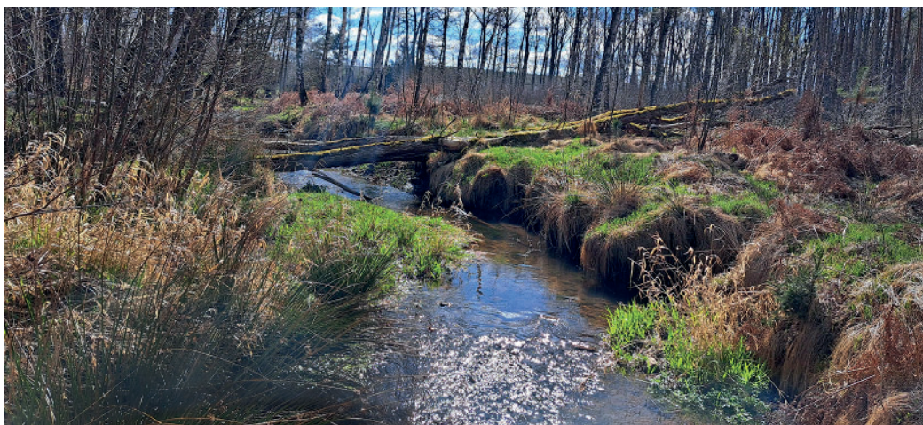
Ein naturnahes Gewässer mit unterschiedlichem Bewuchs bietet eine große Vielfalt für Lebewesen, aber auch zur Erholung.