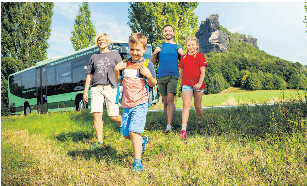
Am Entdeckertag die Region erfahren