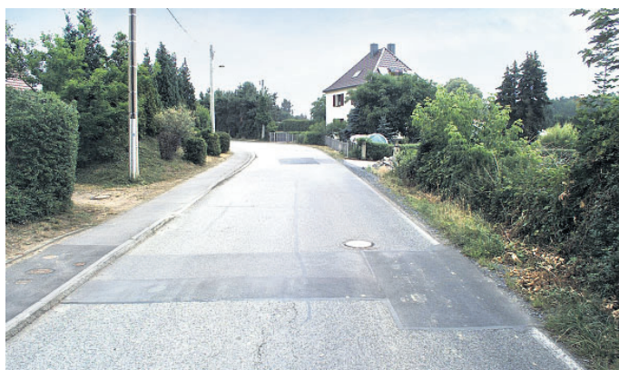
Die Forststraße wird ab Anfang April ausgebaut.

Die großräumige Umleitungsstrecke verläuft über die Moritzburger Straße/Brückenstraße/Hauptstraße zur Dresdner Straße nach Coswig, weiter über die Weinböhlaer Straße und die Moritzburger Straße (in Coswig) durch den Spitzgrund in Richtung Auer. In Weinböhla wird der Verkehr von der Dresdner Straße über die Köhlerstraße zur Forststraße zurückgeführt.