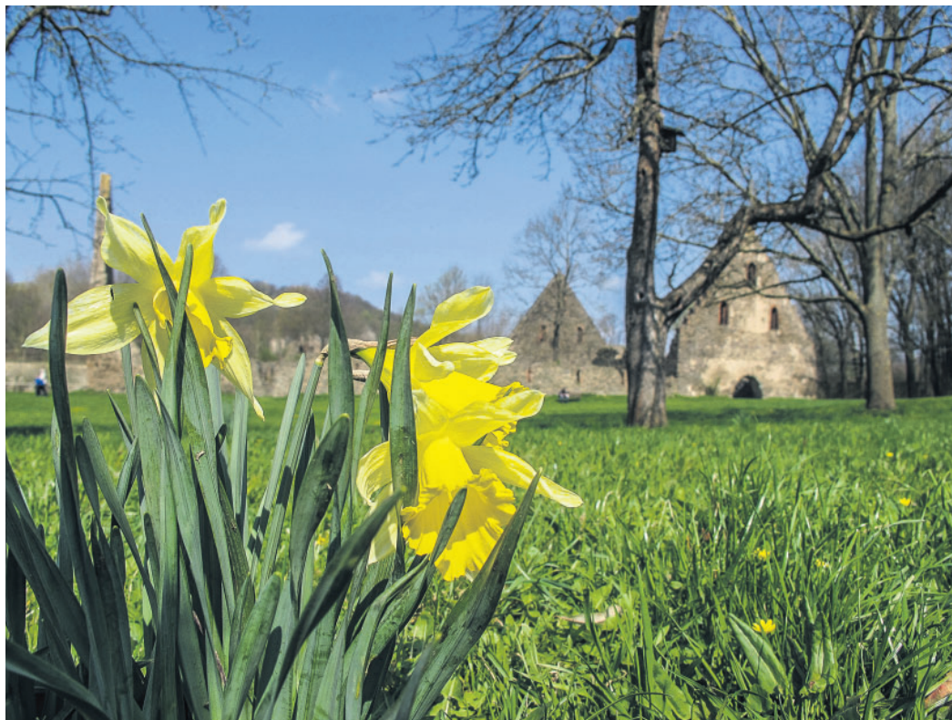
Klosterpark Altzella: (KI)Ostersparziengang für die ganze Familie am 5. April

▪ „Unsichtbar“ – Austausch zu ME/CFS, Long-Covid-Syndrom und Post-Vac-Syndrom