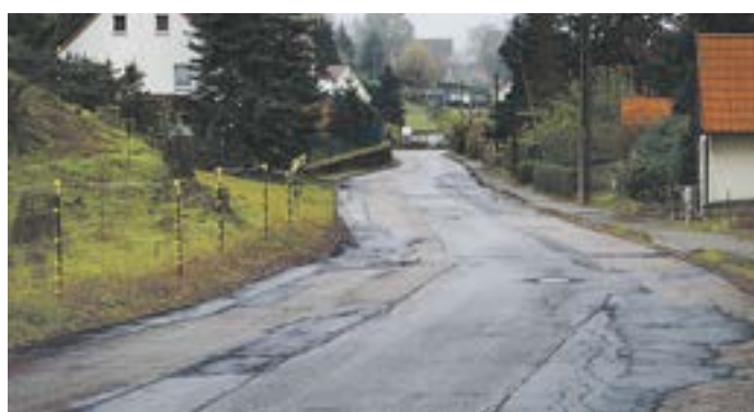
Der derzeitige Zustand der Ortsdurchfahrt

Der Landkreis Meißen plant, beginnend im Mai 2026, die Instandsetzung der Ortsdurchfahrt Taubenheim in der Gemeinde Klipphausen. Die jetzt vorhandene Befestigung der Straße ist von Schadstellen und Rissen geprägt und eine geregelte Oberflächenentwässerung nicht gewährleistet. Mit der geplanten Fahrbahnerneuerung - einschließlich der Gerinne und Straßenabläufe - werden die vorhandenen Mängel beseitigt und die Sicherheit der Verkehrsteilnehmer erhöht sowie die Lärmbelastung erheblich reduziert.