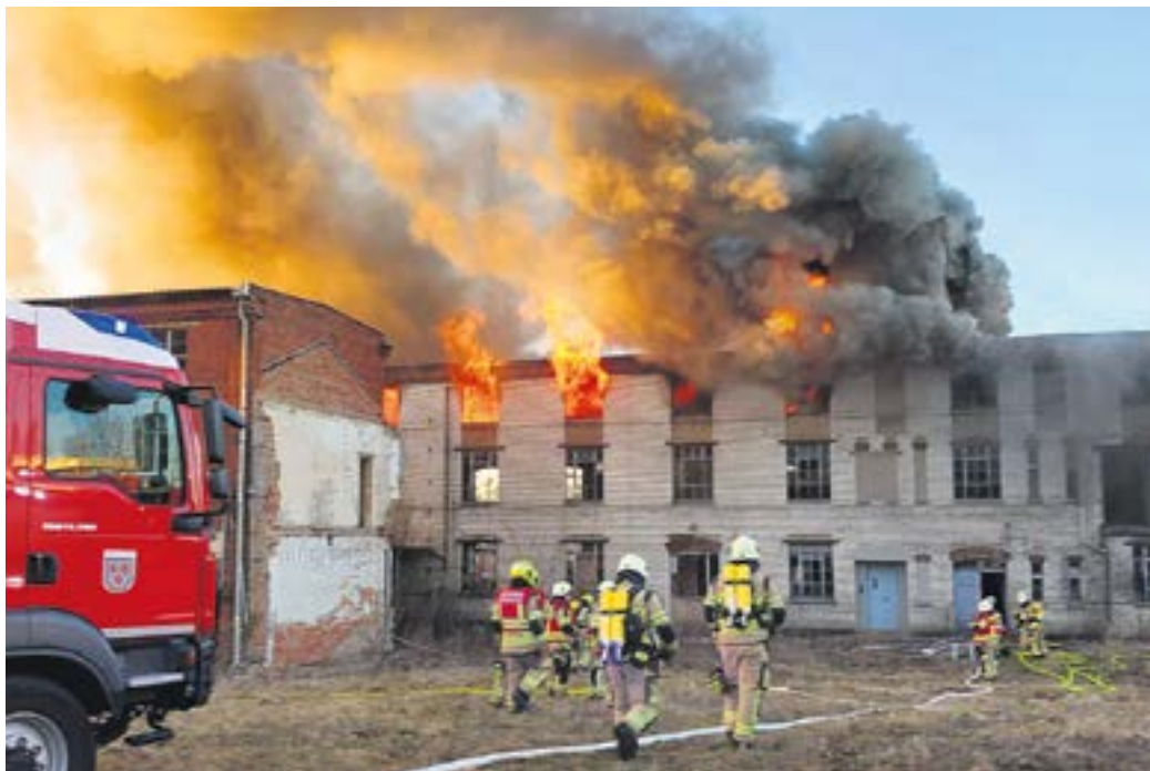
Brand der „Alten Puppenfabrik“ in Nossen

Die meisten Einsätze waren im Juni (300), gefolgt von Juli (276) und August (234) zu verzeichnen. Am ruhigsten war es für die Kameradinnen und Kameraden im Februar (168 Einsätze) und November (161 Einsätze) 2025. Die Tage mit den meisten Alarmierungen waren im vergangenen Jahr: Freitag (390), Samstag (387) und Sonntag (378). Dabei ist die Zeit zwischen 10 und 16 Uhr am „gefährlichsten“: die meisten Alarmierungen erfolgten um 16 Uhr (176) und 14 Uhr (172).