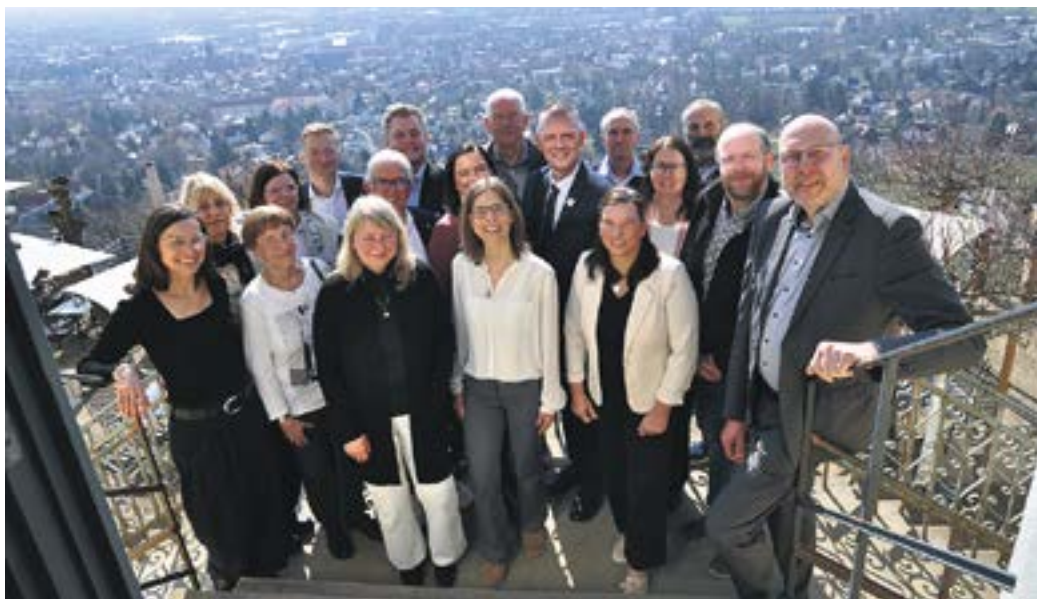
Gewürdigte Wegbegleiter und Laudatoren anlässlich 35 Jahre Tourismusverband Elbland Dresden