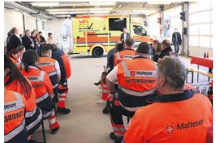
Landrat Ralf Hänsel bei der Einweihung

„Sieben Millionen Euro werden wir am Ende in die neue Rettungswache investiert haben. Ein hoher Betrag, aber gleichwohl gut investiertes Geld, denn die neue Rettungswache Großenhain ist ein weiterer Meilenstein zur Sicherung der hohen Qualität des Rettungsdienstes im Landkreis Meißen. Mit dieser Investition verbessern wir nachhaltig die Gesundheit und die medizinische Versorgung der Men-