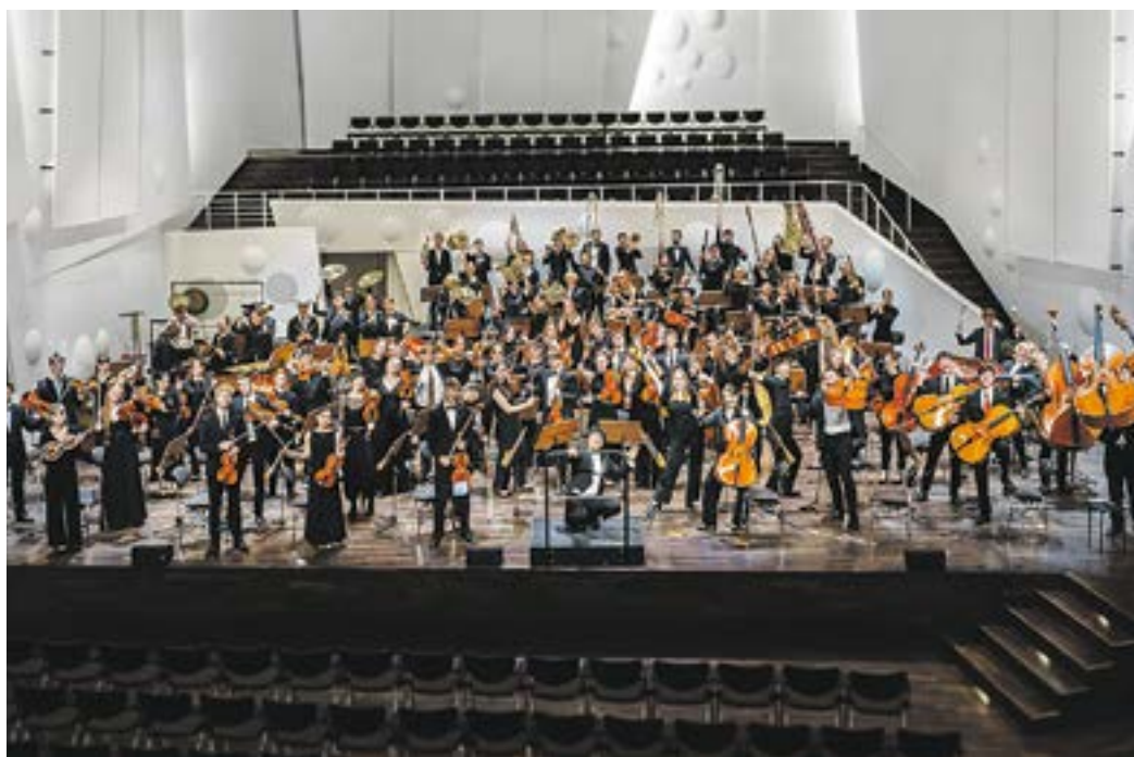
Das Landesorchester Sachsen kommt am Samstag, 11. April mit dem Konzert „Hadaf und Tacheles“ in die Lutherkirche Radebeul.