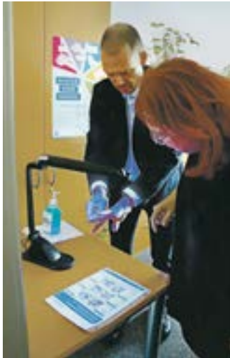
Landrat Ralf Hänsel beim Test der Handhygiene

Die kleinen Gäste nutzten die „Teddydoktor-Sprechstunde“ des Kinder- und Jugendärztlichen- und -zahnärztlichen Dienstes. Beim Röntgen und Abhören des Plüschtiers verschwand die Angst vor dem eigenen Arztbesuch. Die Zahnfeen