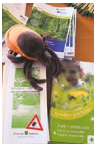
Das Gesundheitsamt Meißen bietet umfassendes Informationsmaterial zur Thematik

Die Mitarbeiterinnen und Mitarbeiter im Gesundheitsamt Meißen führen neben den üblichen Standard- sowie Indikationsimpfungen (bei Auslandsreisen) auch die FSME-Impfung durch. Jeweils am ersten Dienstag im Monat von 13 bis 17 Uhr sowie immer donnerstags von 9 bis 11.30 Uhr können Interessierte ohne Termin ins Gesundheitsamt Meißen zum Impfen kommen. Zu den weiteren Öffnungszeiten wird vorab um eine Terminvereinbarung unter Telefon 03521 725-3434 oder 03521 725-3438 gebeten.