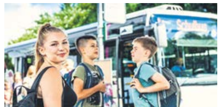
Mit dem Bildungsticket sind Schülerinnen und Schüler mobil.

Das Bildungsticket gibt es für alle Schülerinnen und Schüler an allgemeinbildenden Schulen, für Lernende an berufsbildenden Einrichtungen in rein schulischen