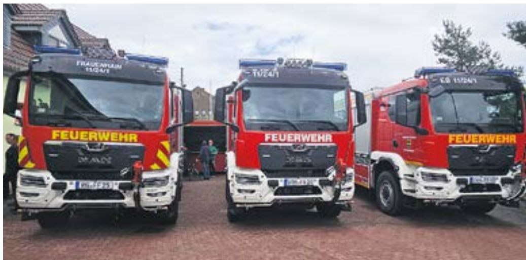
Die drei TLF 4000