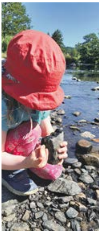
Bei einem genauen Blick ins Gewässer, kann man vieles entdecken.

Und wie kann man die Tiere nun beobachten? Bei größeren Tieren ist das mit etwas Geduld und Glück vor allem in naturbelassenen Gewässern gar nicht so schwer. Vögel, Libellen oder Fische kann man da durchaus