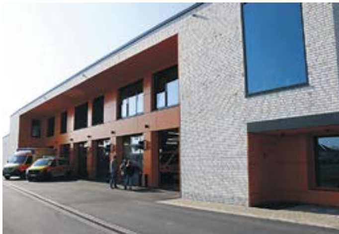
Außenansicht der neuen Rettungswache Großenhain

Bei der Planung der Rettungswache spielten neben Aussehen, Funktionalität und Wirtschaftlichkeit auch