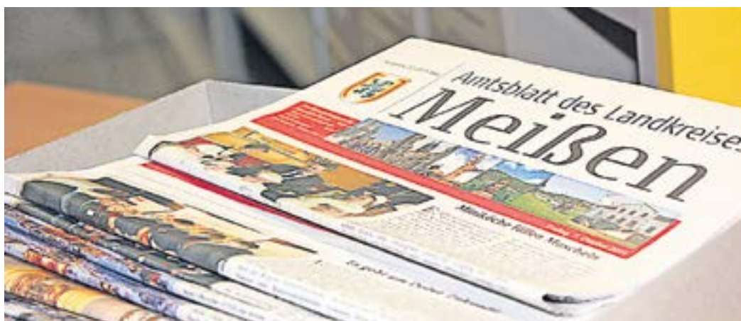
Zurückgeblättert im Archiv des Landkreises

Die Riesaer Polizei suchte vor zehn Jahren wegen Personalmangel Unterstützung bei der Verkehrsüberwachung, worauf sich die Freiwillige Feuerwehr meldete, um Einnahmen für ihr Feuerwehrgeschäft zu generieren, wie die Lokalzeitung berichtete. Ein Bild zeigte Polizisten mit Feuerwehrmännern bei einer Einweisung am Blitzer. Doch Moment – solch ein Artikel am 1. April?