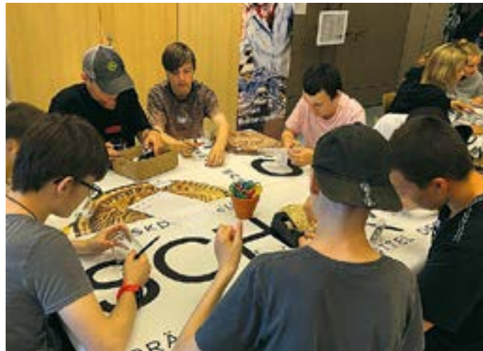
Bildungsfahrt ins Residenzschloss Dresden: Schülerinnen und Schüler gestalten im Rahmen eines museumspädagogischen Workshops eigene kreative Arbeiten – unterstützt durch das KuBi.mobil-Programm.

Förderhöhe: 9 Euro pro Teilnehmer (inklusive Begleitpersonen im Schlüssel 1:12).